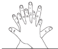
2. Paume sur dos Désinfection des doigts et des espaces interdigitaux