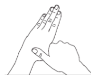
4. Pouces Désinfection des pouces