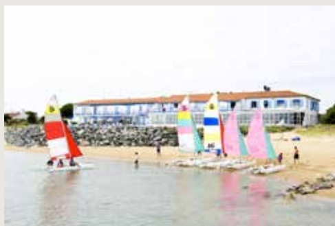
Planche à voile, char à voile, surf, golf, équitation, thalassothérapie.