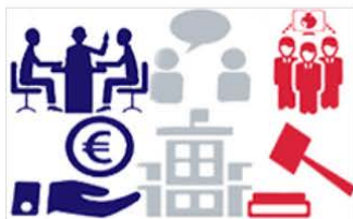
LES INDISPENSABLES (AUTO-INSCRIPTION)