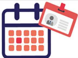
GRH - MANAGEMENT