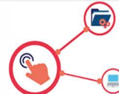
ANIMATION DU RESEAU "ACCES RESERVE"