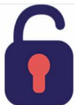
LES FORMATIONS EN AUTO-INSCRIPTION