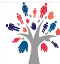
EGALITE ET DIVERSITE