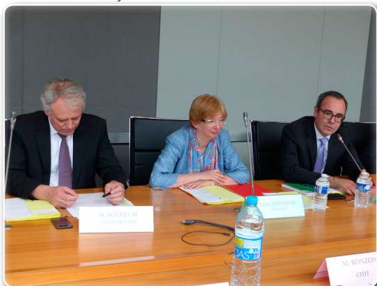
Réunion du CHSCT d'administration centrale le 5 juin 2018 à la salle des Commissions sur le Lumière