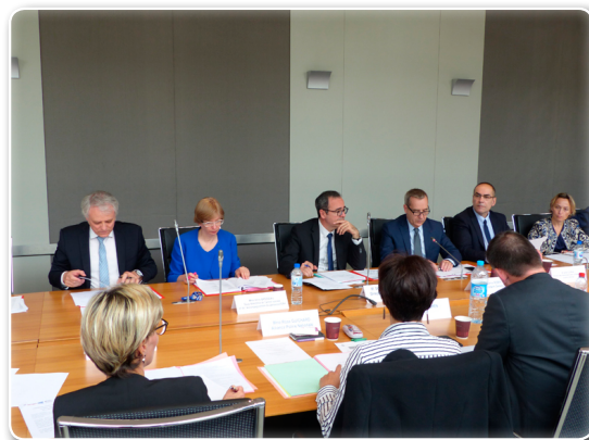
Réunion de la plénière CNAS le 18 juin 2018 à la salle des Commissions sur le Lumière