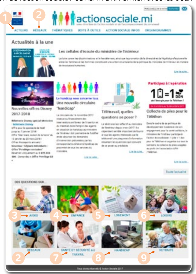
Des sous-rubriques sont proposées pour chaque thématique afin de vous guider.

>>> En savoir plus >>> Nouvel Intranet de l'action sociale : > http://actionsociale.mi ou > http://actionsociale.interieur.ader.gouv.fr